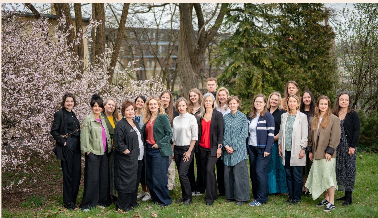
Centrs Dardedze komanda, 2025.gada aprīlis

Novērst bērnu seksuālu izmantošanu un nodrošināt palīdzību bērniem, kas piedzīvojuši jebkāda veida vardarbību, un viņu ģimenēm.