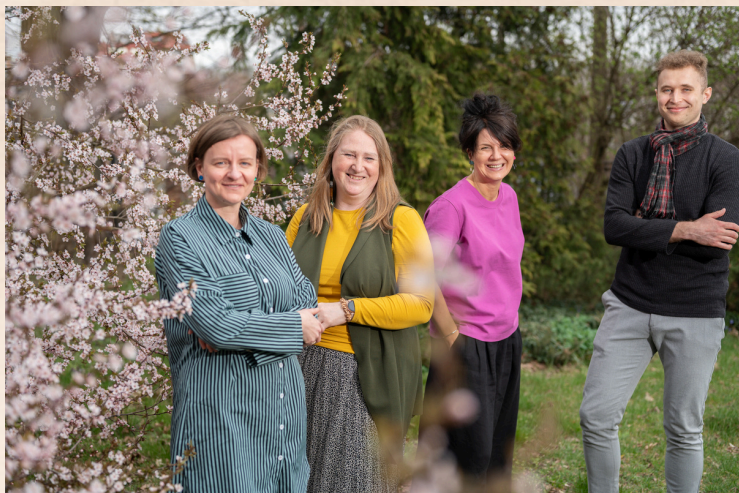
Džimbas komanda, 2025.gada pavasaris

2025. gadā Džimbas drošības soļu programmā bija 400 abonenti , no kuriem 64 bija jauni. Programma aptvēra 79% pašvaldību (34), tajā darbojās 455 aģenti .